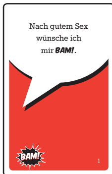
80 rote BAM! -Karten