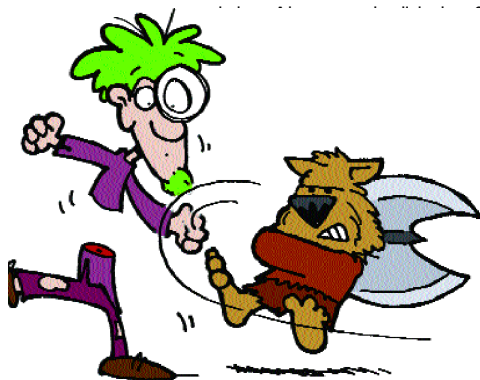
eine Stufe auf.

Die besonderen Fähigkeiten oder Verletzlichkeiten eines Monsters beziehen sich auch auf deinen Helfer und umgekehrt. Bist du z.B. ein Wechselbalg, oder ein Wechselbalg hilft dir, wird die Banshee –4 gegen dich bzw. euch