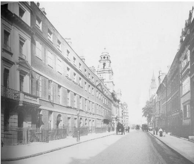
In der Great George Street 1909.

Alle drei Briefe gehen nicht direkt bei Scotland Yard ein, sondern erreichen die Polizei auf Umwegen. Die Charaktere erfahren von ihnen durch ihre Beziehungen zum Yard oder zum Coroner. Sind solche Beziehungen nicht vorhanden, können die Briefe auch in der Zeitung abgedruckt worden sein. Die handgeschriebenen Originale bewahrt dann Scotland Yard auf und zeigt sie nur jemandem, der die Polizisten mit Ansehen und einem schweren Wurf auf Überzeugen beeindruckt.