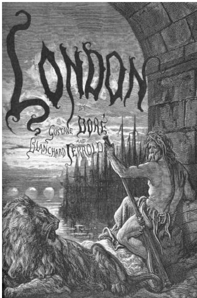
Father Thames auf einem Stich von Gustave Doré.

nicht eine Erfindung Montis; er hatte sich in großem Maße von einem Vorgänger seiner Plastik inspirieren lassen. Dieser Vorgänger, der auf das Jahr 1780 zu datieren ist, modelliert die Themse in einer seiner Plastik so verblüffend ähnelnden Form, dass es nicht Zufall sein könnte. Auf meine Frage hin, warum er die Themse mit einer Schaufel ausgestattet hatte, denn eine solche stützt die Statue auf ihrer Schulter ab, berichtete er traumverloren von seinen wochenlangen Gängen entlang des sumpfigen Flussufers, von Westminster bis nach Woolwich und östlich darüber hinaus. Von den belebten Orten, da man vom Glanz unserer Metropole geblendet war, bis in die kantigen Schatten der Manufakturen und rußigen Fabriken. Dort und weiter hinaus treffe man nur wenige Menschen, mehr geisterhaft auf dem Fluss schwebende Schiffe als Menschen, und zahlreiche Abfälle, im Schlamm gestrandet. Die Menschen dort sind rau und feindselig. Und nur der Gestank, dieser stechende, betäubende Gestank des fauligen Flusses, der begleitet den Wanderer auf Schritt und Tritt. Eines Abends, es war eine der seltenen klaren Nächte, und kein Schiff weit und breit, da habe er den Fluss Themse in seiner wahren Form erblickt. Ein Blubbern auf einer fernen Flussoberfläche habe seine Aufmerksamkeit geweckt, und es tauchte sein mächtiger