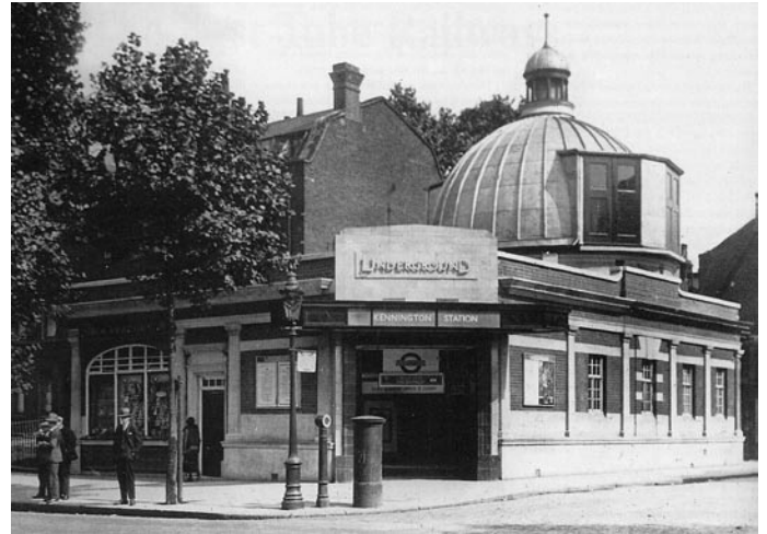
Eingang zur Unterwelt.

Monti, das weiß ich nun, tat ein Gutes daran, den Flussgott abzubilden, den unser glorreiches Volk verdient hätte, nicht jenen grässlichen Dämon, der sich wirklich in den Gewässern aufhält. Jahre der Zerrissenheit unter diesen leidenvollen Bildern, die sich in meinem Gedächtnis eingenistet hatten, folgten nun, und jahrelang bestrebe ich mich, ihnen zu entfliehen. Darauf folgte eine Ewigkeit der Reflektionen. Und nach all dieser Zeit, denn anfangs zweifelte ich über meine Geistesgegenwärtigkeit, bin ich von der Realität meiner Erfahrungen überzeugt. Meine Schulter schmerzt an einigen Tagen noch immer so sehr, als wäre es gestern geschehen. Doch, und dies werde ich im letzten Teil dieses Aufsatzes erörtern, reichen die Dimensionen der Thematik weit, weit über dieses unaussprechliche Grauen hinaus. Daher möchte ich nun, da der Leser nun mit meinen