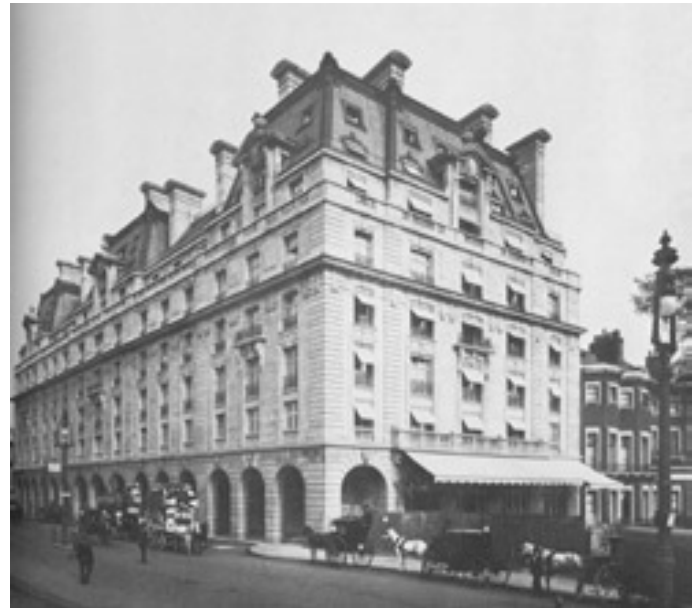
Pferdedroschken warten vor dem „Ritz“ auf einen zahlenden Passagier.

Die Bezeichnung „Inn“ (etwa „George Inn“) tragen zwar in erster Linie Landgasthöfe, aber auch als Name städtischer Pubs ist sie gebräuchlich. Eine Liste heute noch existierender historischer Pubs in London ( mit Adressen ) findet sich übrigens im Internet unter folgender URL: http://www.pubs.com/azlist.htm .