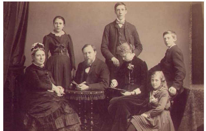
Eine Familie in den 1890ern.

Wie schon im Kapitel des „ Spieler-Handbuchs “ über die Charaktererschaffung angeregt, können Spieler und Spielleiter den Namen ihrer Charaktere eine tatsächliche Aussagekraft verleihen, indem die Bedeutung des Namens einigen Aufschluss über die Persönlichkeit und Psyche eines Charakters zulässt. Man sollte hierbei nicht zu plakativ vorgehen: Namen wie „James Butcher“ für einen Massenmörder oder „Arthur Deadman“ (oder „Robert