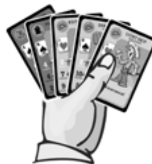
Deine Handkarten (in deiner Hand, Partner)