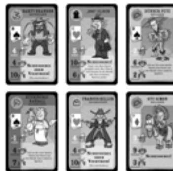
Bande (offen auf dem Tisch)

Einige Stadtkarten haben den Satz „Egal, wie diese Karte gespielt wird, sie wird immer in die Bande mit dem schlechtesten Pokerblatt gelegt.“ oder Ähnliches aufgedruckt. Wenn du eine solche Karte spielst, bestimme zuerst, in welche Bande sie gelegt wird und befolge dann den Text des Spezialeffektes. Wenn eine solche Karte in einem Stich gespielt wird, bestimme, in welche Bande diese Karte gelegt wird, verwende dann den Schießerei- oder Viehtriebwert, aber ignoriere den Rest des Spezialeffektes. Wenn in einem Stich mehrere dieser Karten auftreten, werden sie immer in der Reihenfolge verteilt, in der sie gespielt wurden.